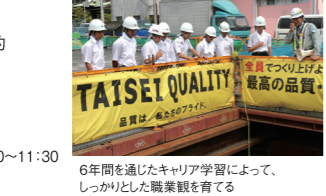
6年間を通じたキャリア学習によって、しっかりとした職業観を育てる

※中高一貫校のため、高校募集は行いません。 【入試説明会】(個別相談・校内自由見学会含む) ※要予約 ●1月12日(日) 10:00~12:00 【イブニング説明会】 ※要予約 ●12月20日(金) 18:30~20:00 【ミニ説明会】 ※要予約 ●11月30日、12月7日、1月18日・25日 ※いずれも土曜10:00~11:30 詳しくは、当校ホームページをご覧ください。