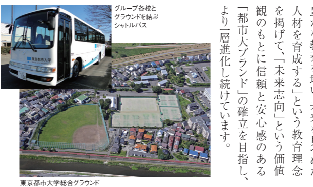
グループ各校とグラウンドを結ぶシャトルバス

未来志向の人材育成を目指して、グループを形成、連携を図る。日本経済発展のため、工学を中心として、次代を見据えた教育と研究に邁進してきた武蔵工業大学は、創立80年目の2009年4月、その名を「東京都市大学」(都市大)へと改称。従来の工学部、知識工学部(以上、世田谷キャンパス)と、環境情報学部(横浜キャンパス)に加え、等々力キャンパスに都市生活学部と人間科学部を開設し、理工系、文理複合系、文系の5学部16学科を擁する総合大学となりました。これに併せて、付属の高校3校、