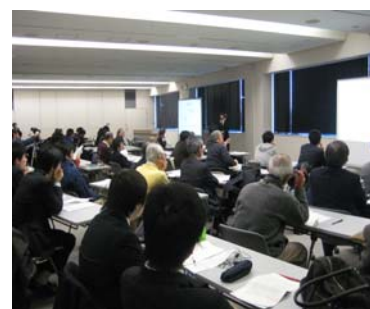
※平成22年度発表会の様子